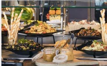
帆船美食廣場：供應早午晚三餐的環球美食自助餐