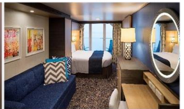
海景露台房 (1D/2D/3D/4D/5D)：198 平方呎