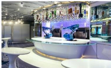
*機器人酒吧：科技感十足的機器人酒吧，輕鬆下達指令，即可調製專屬特飲