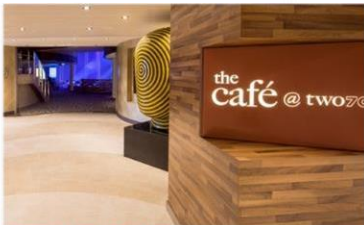
270 度咖啡廳：供應早午餐，品嚐多款熱三文治、自選沙律及自家製濃湯