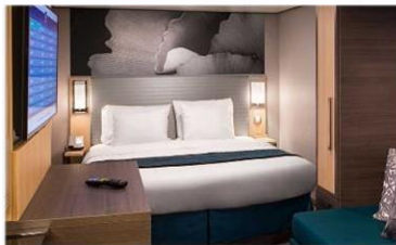
內艙房 (1V/2V/3V/4V)：166 平方呎