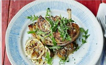
*Jamie's Italian：供應午晚餐，由名廚 Jamie Oliver 主理，打造正宗意式風味