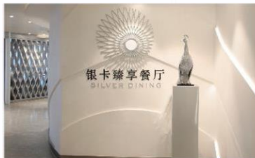
Sea Class 海際套房系列專屬餐廳