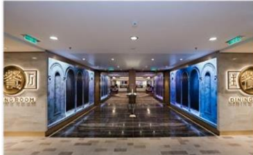
主餐廳：供應早午晚三餐的中西式美食