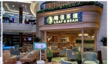
*咖語茶道：滿足各年齡層賓客，供應中國茶、咖啡等冷熱飲品，以及現烘中西式點心