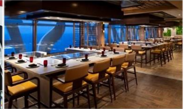
*日式鐵板燒：供應午晚餐，提供新鮮海產及頂級肉類，正宗日式美食應有盡有