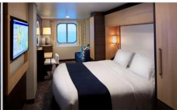
海景房 (1N/2N)：182 平方呎