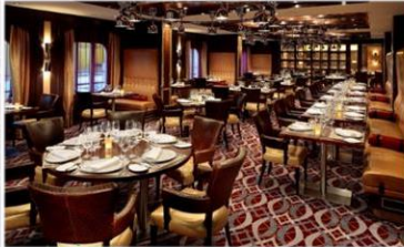
*美式扒房：供應午晚餐，品嚐傳統牛排餐廳的經典美食