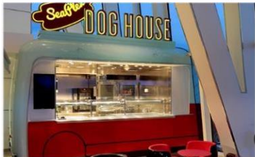
熱狗屋：品嚐不同風格的熱狗：紐約風格、芝加哥風、格或你的個人風格。