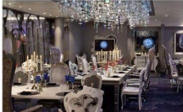
*大董意境坊：供應晚餐，與名店大董合作，體驗中國風的意境菜