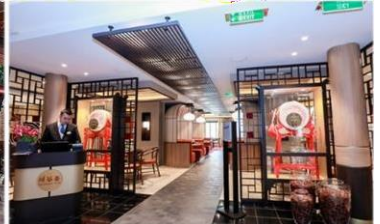
*川谷薈：供應午晚餐，品嚐正宗川菜風味