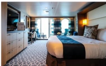
標準套房 (海際套房系列) (J1/J4)：276 平方呎