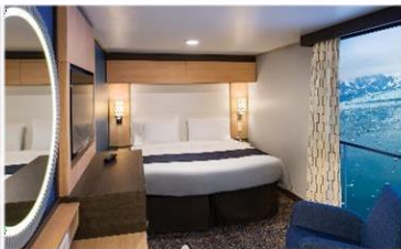
虛擬露台內艙房 (1U/2U)：166 平方呎