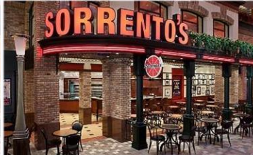
索倫托餐廳：供應午晚餐的意式 Pizza 美食